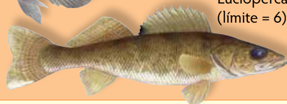
Lucioperca (límite = 6)