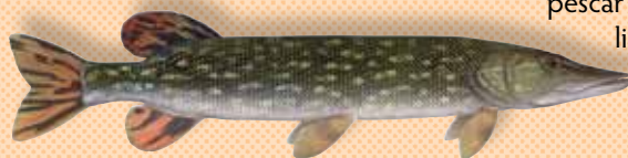
Lucio norteamericano (límite = 3)