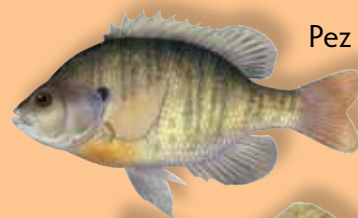
Pez sol (límite = 20)

La mayoría de las personas de 16 años de edad o mayores necesitan tener una licencia en su poder cuando pescan.* Hay distintos tipos de licencias de pescar. Utilice este diagrama para averiguar qué licencia puede obtener.