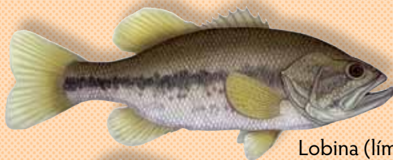
Lobina (límite = 6)