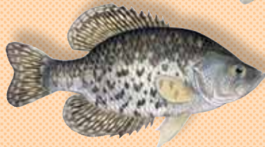
Pomosio (límite = 10)